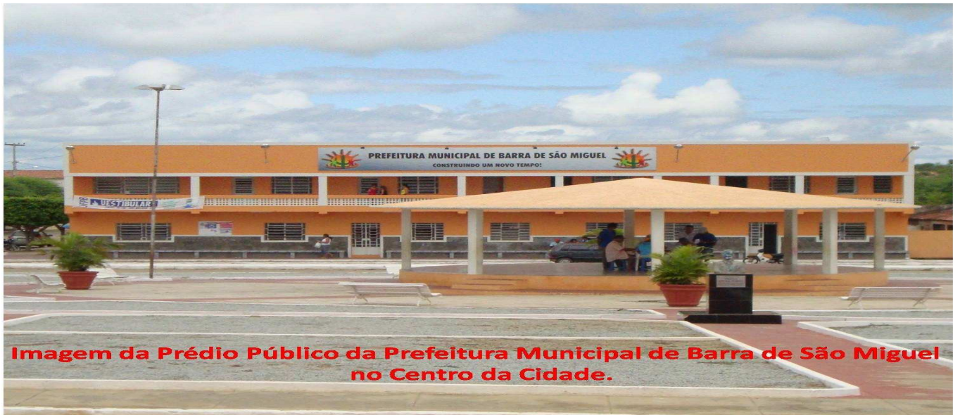
Imagem da Prédio Público da Prefeitura Municipal de Barra de São Miguel no Centro da Cidade.