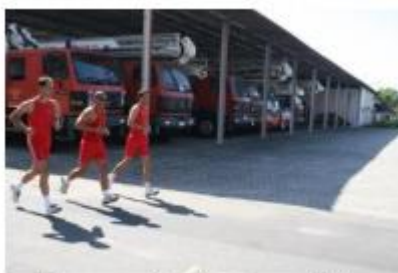
Execução do exercício

9.3.1. Corrida de 12 minutos: consiste num exercício para o qual o candidato efetuará um deslocamento contínuo, podendo andar ou correr, onde a distância percorrida será convertida em pontos de acordo com as tabelas I e II.