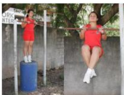
Posição inicial Execução do exercício

9.3.3. Barra estática (feminino): consiste na permanência em pegada de pronação (palmas das mãos voltadas para frente, dorsos das mãos voltados para o rosto), com o queixo ultrapassando a linha da barra, pelo maior tempo possível, em isometria, sem o auxílio de qualquer outro meio de sustentação que não sejam as mãos. Somente a partir da tomada de posição, com os braços flexionados e o queixo acima da linha superior da barra, com a cabeça na posição normal (olhando para frente) é que o cronômetro será acionado. Durante a execução, a candidata deverá manter o corpo retesado, como se houvesse uma linha reta partindo do calcanhar até o ombro e permanecer até o final do tempo exigido, para só depois retirar-se da barra, não sendo permitido balanceio, flexão dos joelhos, cruzamento das pernas, tocar o pé no solo ou qualquer parte do suporte do aparelho da barra fixa após o início do teste, não podendo apoiar o queixo na barra e nem utilizar luva(as) ou qualquer outro material para proteção das mãos, caso contrário será eliminada. O tempo de permanência será convertido em pontos conforme tabela II.