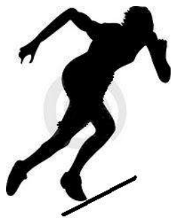
A – 2