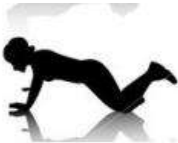
A - 4