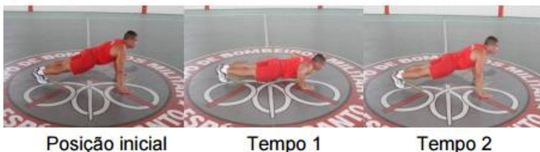
TABELA DE PONTUAÇÃO APOIO DE FRENTE SOBRE O SOLO REMADOR EM 1 MINUTO Idade de 18 até 40 anos

superiores. Durante a execução, o candidato não poderá sair da posição necessária para a execução do exercício, caso contrário, será eliminado. O total de repetições será convertido em pontos de acordo com a tabela I.