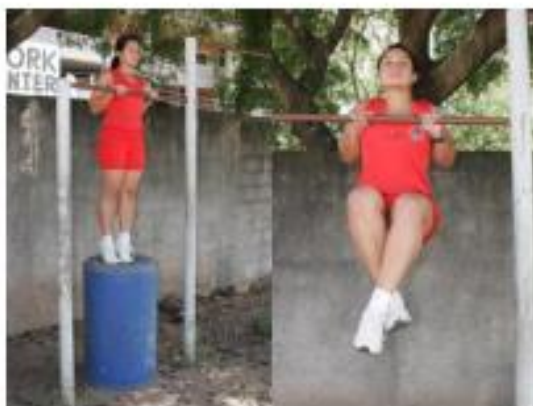
Posição inicial Execução do exercício

9.3.3. Barra estática (feminino): consiste na permanência em pegada de pronação (palmas das mãos voltadas para frente, dorsos das mãos voltados para o rosto), com o queixo ultrapassando a linha da barra, pelo maior tempo possível, em isometria, sem o auxílio de qualquer outro meio de sustentação que não sejam as mãos. Somente a partir da tomada de posição, com os braços flexionados e o queixo acima da linha superior da barra, com a cabeça na posição normal (olhando para frente) é que o cronômetro será acionado. Durante a execução, a candidata deverá manter o corpo retesado, como se houvesse uma linha reta partindo do calcanhar até o ombro e permanecer até o final do tempo exigido, para só depois retirar-se da barra, não sendo permitido balanceio, cruzamento das pernas, tocar o pé no solo ou qualquer parte do suporte do aparelho da barra fixa após o início do teste, não podendo apoiar o queixo na barra e nem utilizar luva(as) ou qualquer outro material para proteção das mãos, caso contrário será eliminada. O tempo de permanência será convertido em pontos conforme tabela II.