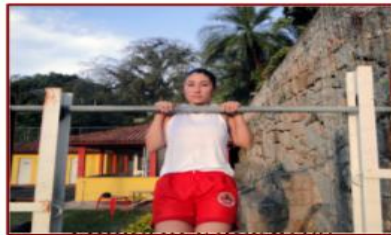
POSIÇÃO INICIAL (0)