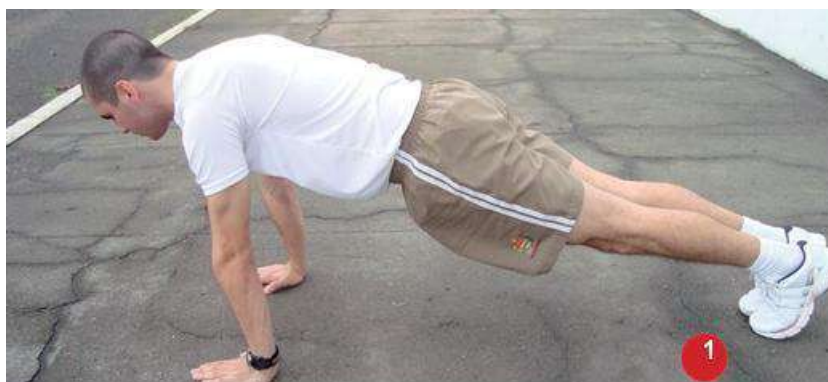
Posição Inicial: 1