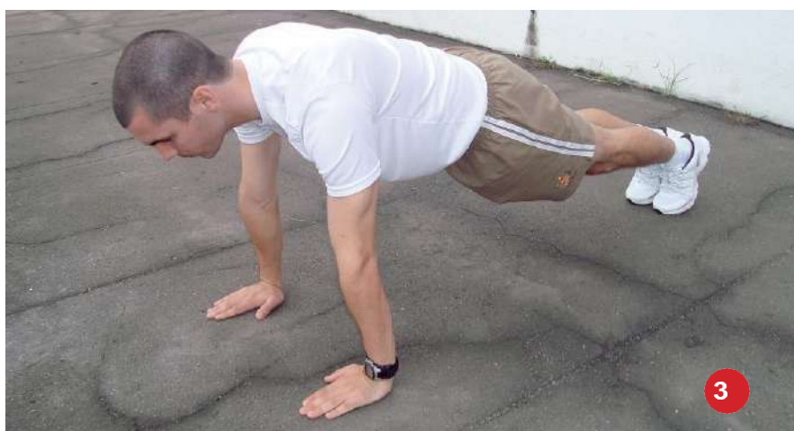
Posição final: 3

O avaliado se posiciona inicialmente deitado, peito voltado ao solo (de- cúbito ventral), pernas estendidas e unidas e pontas dos pés tocando o solo (1);