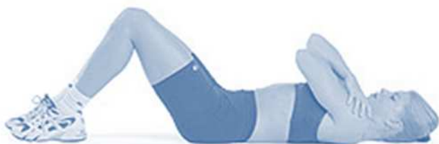
Figura 02: Posição inicial do candidato no teste de abdominal com flexão completa do tronco.