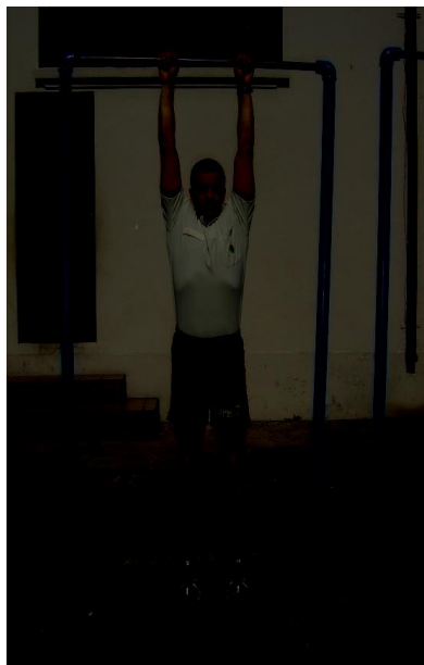
Figura 2 – Posição inicial 01 e, posição final 03.

Santa Isabel do Ivaí – Paraná - SITE: www.saaesii.com.br