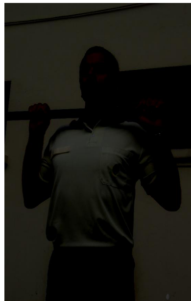
Figura 3 – Posição 02 intermediária.